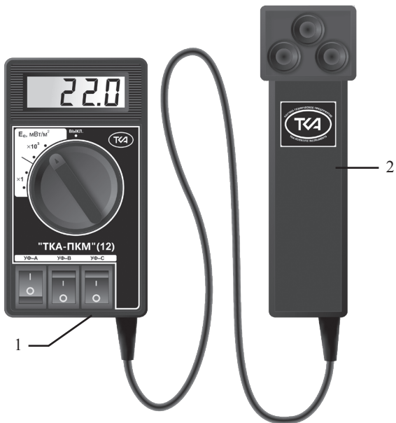
Рис.1. Внешний вид прибора “ТКА-ПКМ”(12)