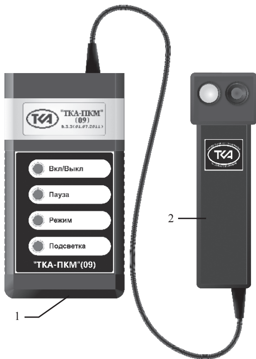
Рис.1. Внешний вид прибора “ТКА-ПКМ”(09)